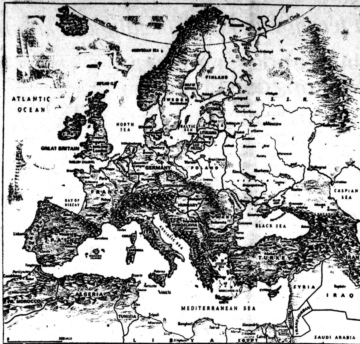
KONPERENSI PERDAMAIAN TENTANG AUSTRIA:

Banjak dari orang2 ini ingin su- pada Sweden, Norwe dan Denmark bersatu didalam satu blok pertahan- an jang netral, dengan dapat soko- ngan tidak setjara formal dari USA. Mereka memandang dengan hormat kepada angkatan udara Sweden jang mutakhir — satu2nya angkatan u- dara jang tangguh diantara Rusia de- ngan Britania — tulang punggung dari pertahanan Skandinawia.